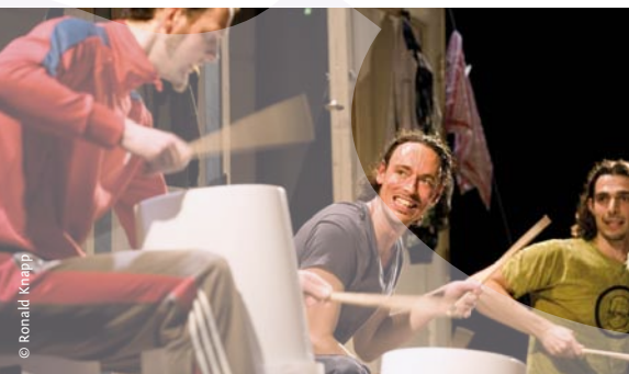
Twitching Eye Trio